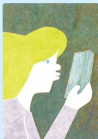
本に夢中 (2024年/前期展示)