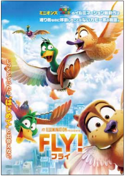
© 2023 Universal Studios. All Rights Reserved. 日本語吹替・字幕あり