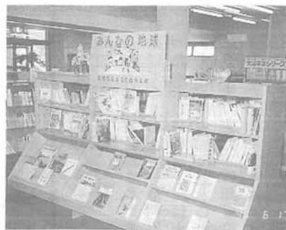
「みんなの地球」図書展示

六月五日の「世界環境の日」から約二〇日間、「みんなの地球・環境問題がよくわかる本」をテーマに環境問題についての本、約二百冊を集めて図書展示を開催しました。