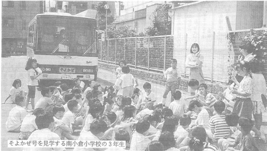
そよかぜ号を見学する南小倉小学校の3年生

平成五年度に入り、小学生の図書館見学が急増しています。六月末までで十一校の一〇九〇名が、中央図書館や移動図書館を見学しました。この数字は昨年度の八校九三九名をはるかにうわまわり、図書館としてはこれまでの最高となっています。