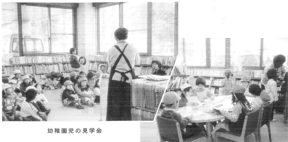
幼稚園児の見学会

宇治市西宇治図書館 〒611-0042 宇治市小倉町山際63-1 西小倉地域福祉センター3階 0774(39)9226