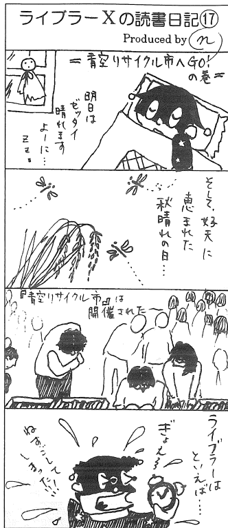
*青空りサイクル市は、今年で8回目を迎えます。

このようなボランティア活動に興味がある方、一度やってみたいと思われる方、どうぞ見学においで下さい。お待ちしております。