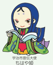
宇治市豊伝大使 ちはや姫