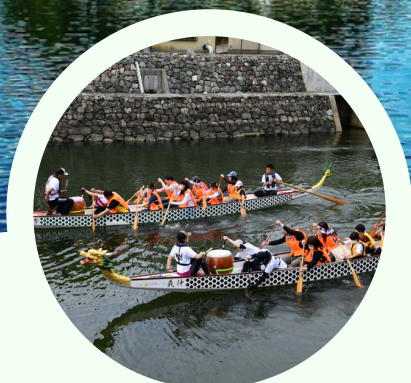
ボート体験 BOAT TRIAL