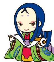
宇治市宣伝大使「ちはや姫」