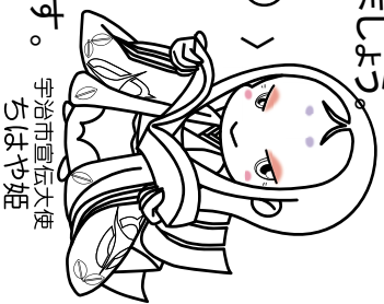
宇治市宣伝大使 ちはや姫