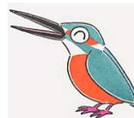
宇治市の鳥：カワセミ