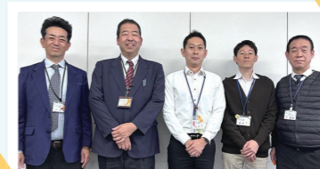
宇治市教育委員会教育支援課