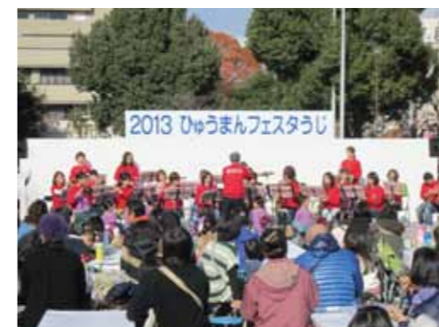
ひゅうまんフェスタうじ