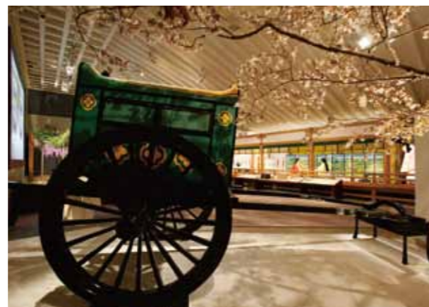
源氏物語ミュージアム 平安の間