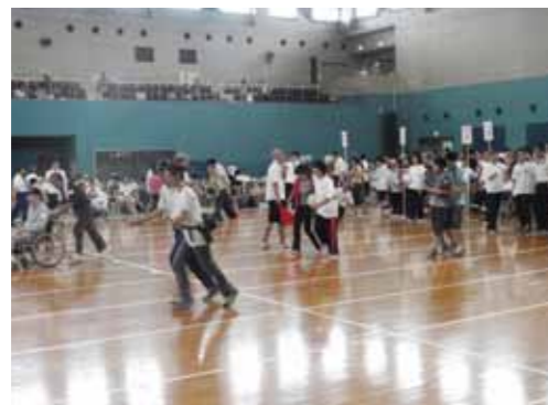
各種スポーツ活動の様子