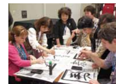
国際交流（カムループス市） 市民歓迎会 日本の文化体験