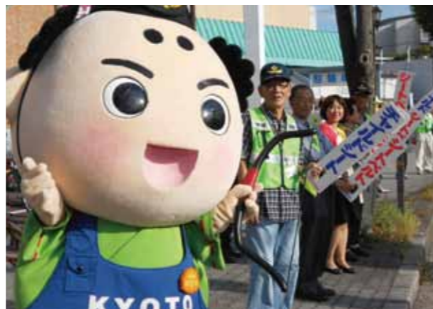
秋の全国交通安全運動（9月30日）