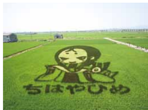
田んぼアート「ちはや姫」