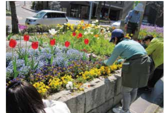
みどりのボランティア活動