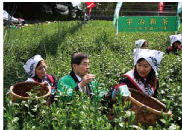
八十八夜茶摘みの集い