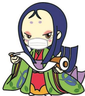
宇治市宣伝大使 ちはや姫

宇治市地球温暖化対策地域推進計画の策定を記念し、 平成 20 年度に市民のみなさんから募集した標語の中から選考された優秀作品です。