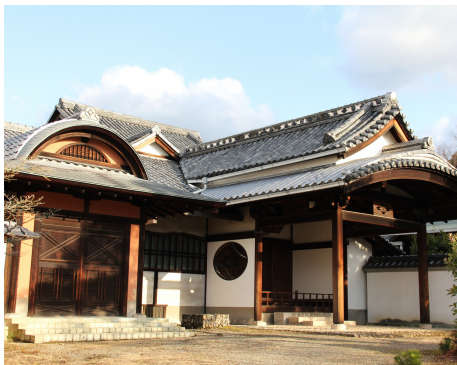
四角や丸を組み合わせた独特のデザイン