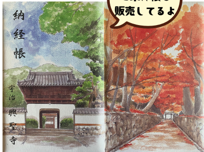
納経帳 宇治興聖寺