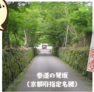
参道の琴坂(京都府指定名勝)