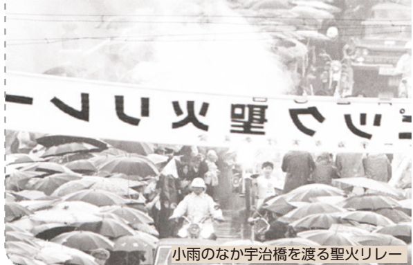
小雨のなか宇治橋を渡る聖火リレー

東京2020聖火リレーが、令和2年5月27日(水)朝に宇治市を出て府南部をリレーするというスケジュールが発表されています。