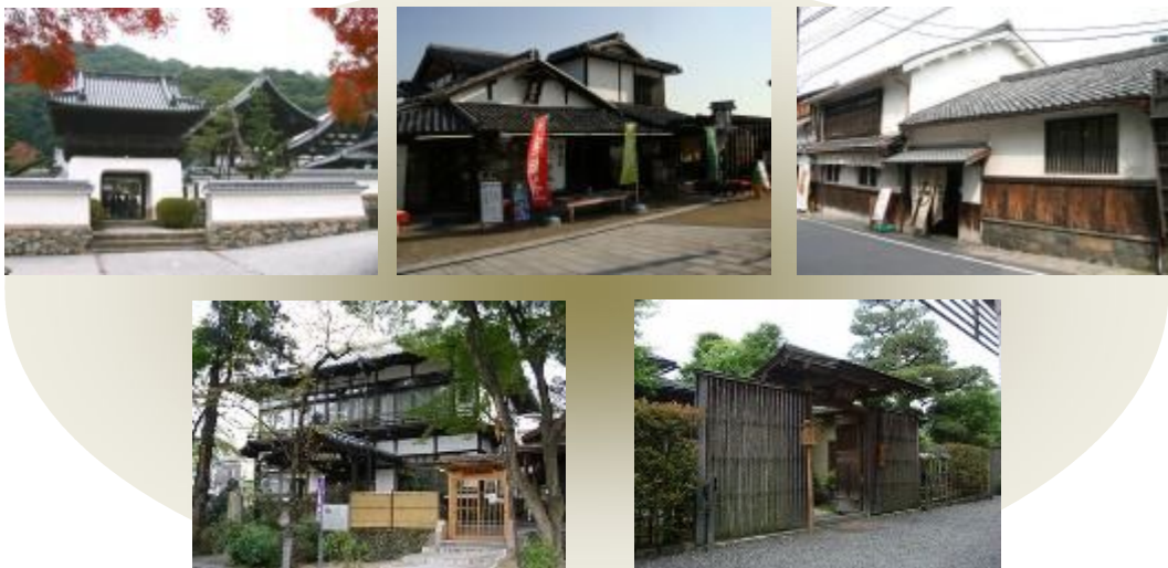
図7-1 歴史的風致形成建造物の指定が想定される事例のイメージ

文化財保護法に基づく登録有形文化財（建造物） 文化財保護法に基づく重要文化的景観の重要な構成要素（届出建物、施設） 京都府文化財保護条例に基づく指定文化財又は登録文化財（建造物） 宇治市文化財指定条例に基づく指定文化財（建造物） 宇治市景観計画に基づく景観重要建造物 その他保全の措置が必要と市長が認めるもの