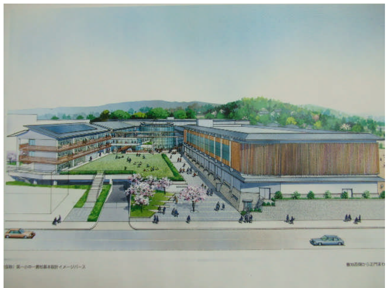
西側から見た、小中一貫校の外観イメージ

宇治小学校が小中一貫校へ踏み出すに際して、これまで以上のご支援とご協力をお願いして、発刊に際してのごあいさつといたします。