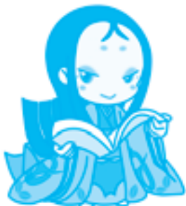
宇治市宣伝大使 ちはや姫