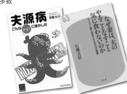
センター 3 階の情報ライブラリーにあります。