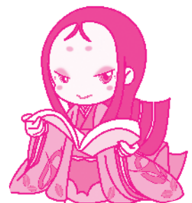
宇治市宣伝大使 ちはや姫

性と生殖に関する健康と権利のことをいいます。1994年(平成6年)の国際人口・開発会議で「行動計画」が採択され、日本も批准しました。いつ、何人くらいの子どもを持つか、持たないか、避妊、不妊、人工妊娠中絶など、性や生殖に関わる健康や権利がうたわれており、年齢、性別、婚姻状態などに関わらない個人の権利を守る概念として重要視されています。本市は第4次UJあさぎプランにおいて、基本方向4「安全・安心な暮らしの実現」の中の計画課題3「生涯を通じた女性の健康支援」で、リプロダクティブ・ヘルス/ライツに関する普及・啓発を推進することとしています。