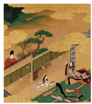
「源氏絵鑑帖」より 巻45 橋姫(当館蔵)

当館所蔵の伝土佐光則筆「源氏絵鑑帖」は、折本二帖からなる源氏絵の画帖で、巻一桐壺から巻五十四夢浮橋までの、各巻一場面ずつを収めています。本展では、収録されている源氏絵をパネルで紹介いたします。