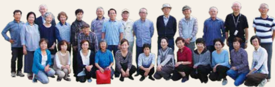
若葉台自治会 助け合い委員会の皆さん

思っているだけでは実現しません。いかにその仕組みを作って、やっていただけるかというのを考えています。