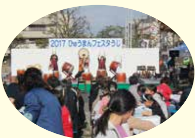
2017 ひゅうまんフェスタラジ