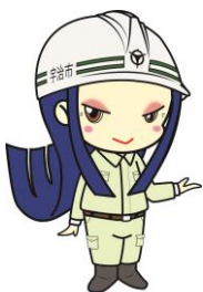
宇治市宣伝大使 ちはや姫