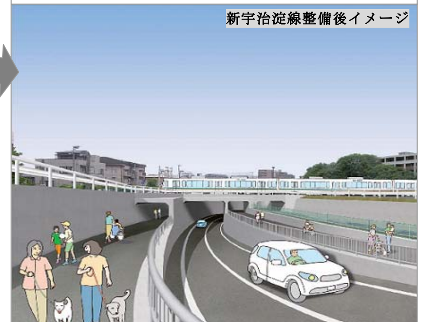
新宇治淀線整備後イメージ

新しく整備される新宇治淀線は、周辺交通渋滞を解消し、歩行者にとっても安全で快適な移動経路を実現します。