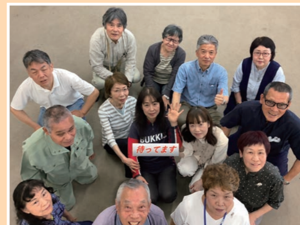
「生活応援隊」の皆さん