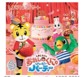
しまじろう