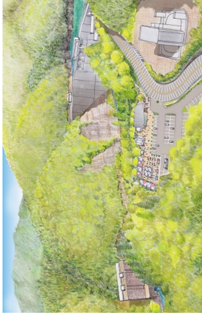
天ヶ瀬ダムがわまちづくり広場（仮称）イメージ図