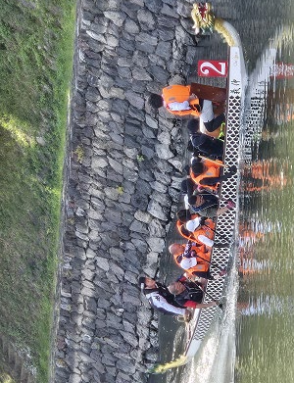
宇治川源平龍舟祭