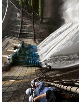
天ヶ瀬ダムツアー