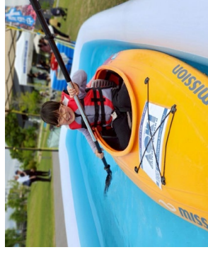
わくわくフェスタ