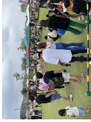
茶づなでのマルシェ