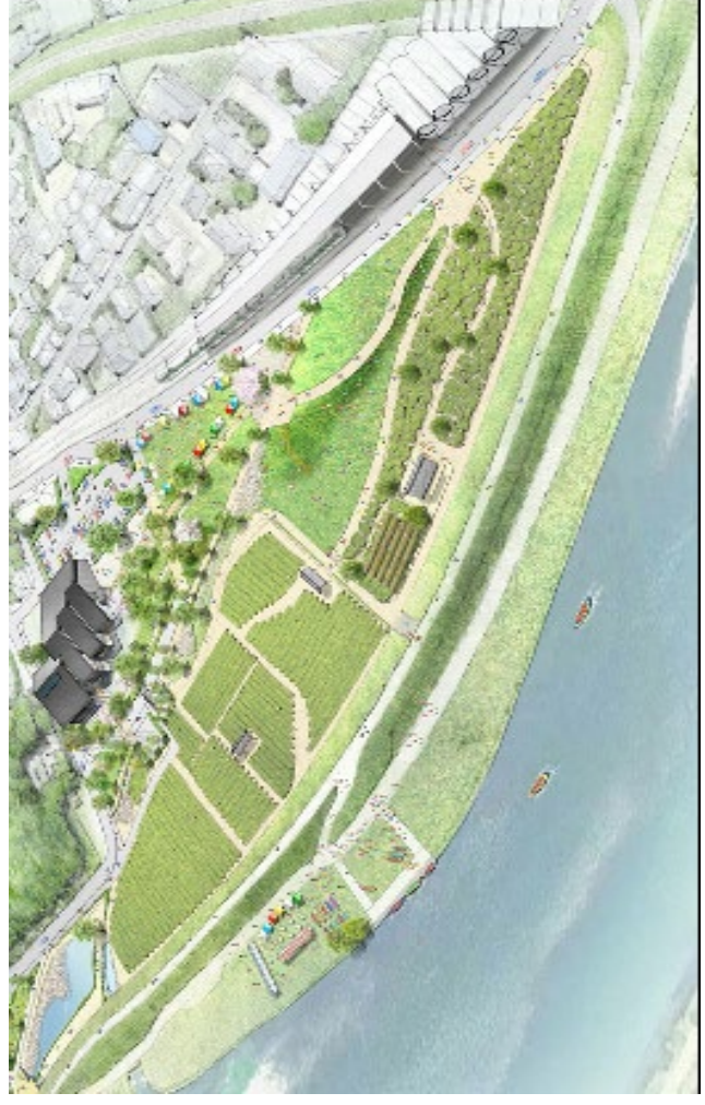
宇治橋地区（茶づな周辺）イメージ図