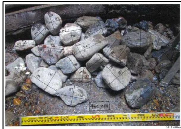
推進機械チャンバー内の玉石