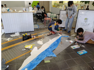
魚を調べて 生き物を作った