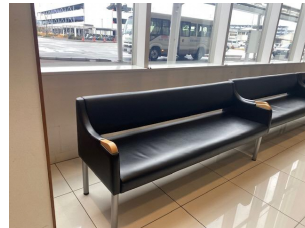
実際に 病院に展示

(しょうた)ぼくたちはまず、魚を調べて生き物を 制作しました。そして、お店に展示して、宇 治に観光に来ている人などに制作水族館を みてもらいました。そして、病院への展示を行 います。