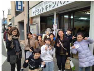
お店に展示をして いろいろな人に みてもらった