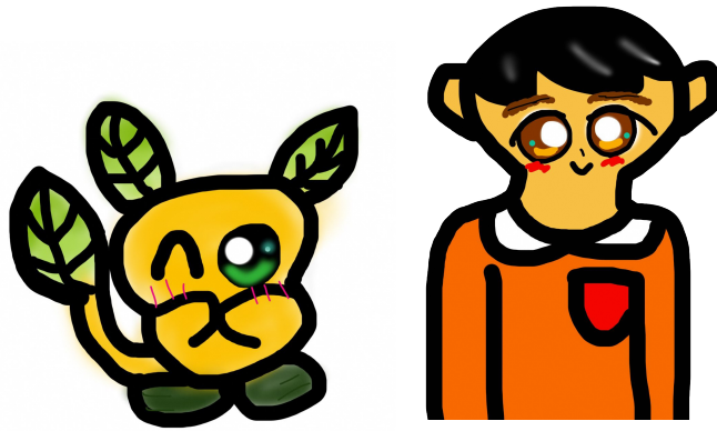
ゲームでつくった「チャーミー」と「主人公」