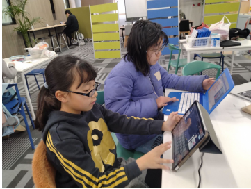
2人で調べたり、 ゲームを作ったりした