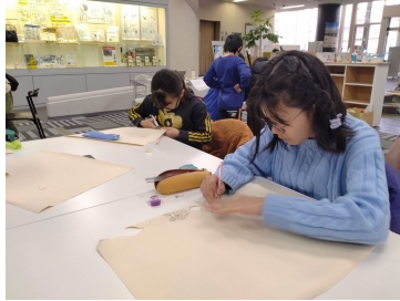
いっしょに葉っぱの キーホルダー作り