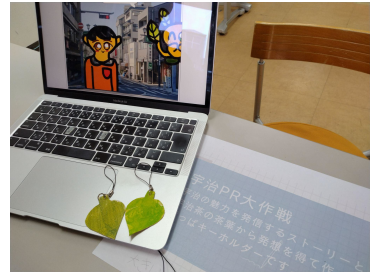
ポップアップストアで 実際に来店を行いました