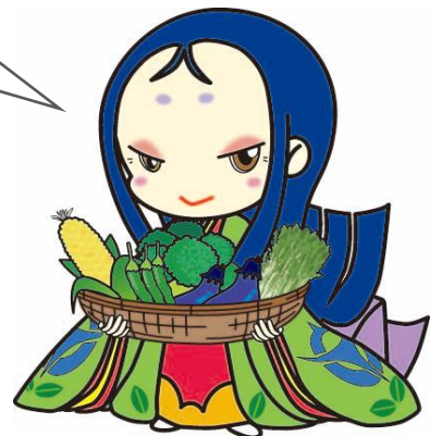
宇治市宣伝大使 ちはや姫