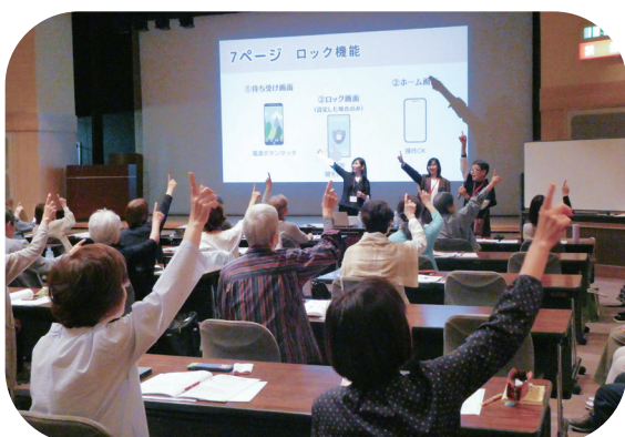
デジタルメディアコース

京都SKY（スカイ）センターはシニアの健康と生きがいがづくりの推進と自主的な活動を支援する団体です。