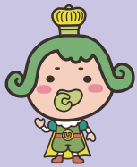
▲チャチャ王国のおうじさま