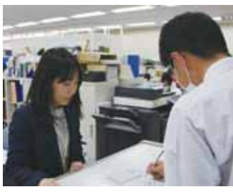
▶あなたも宇治市で働きませんか