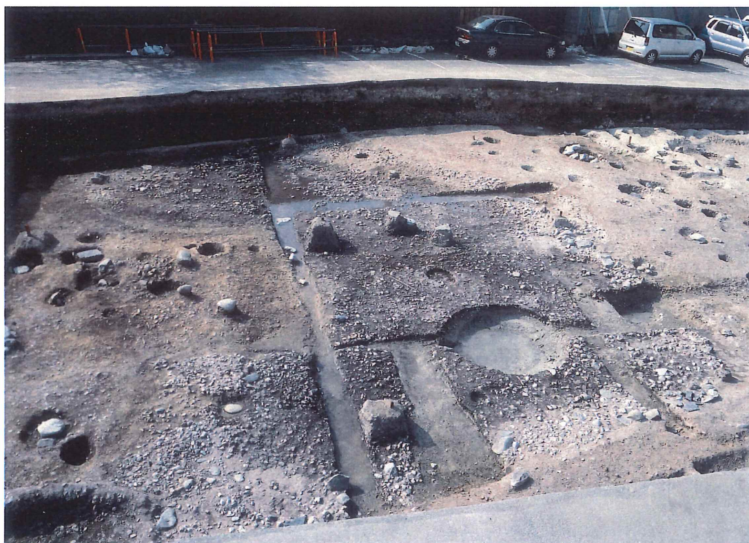
平安後前中期園地 (SG479) …東から