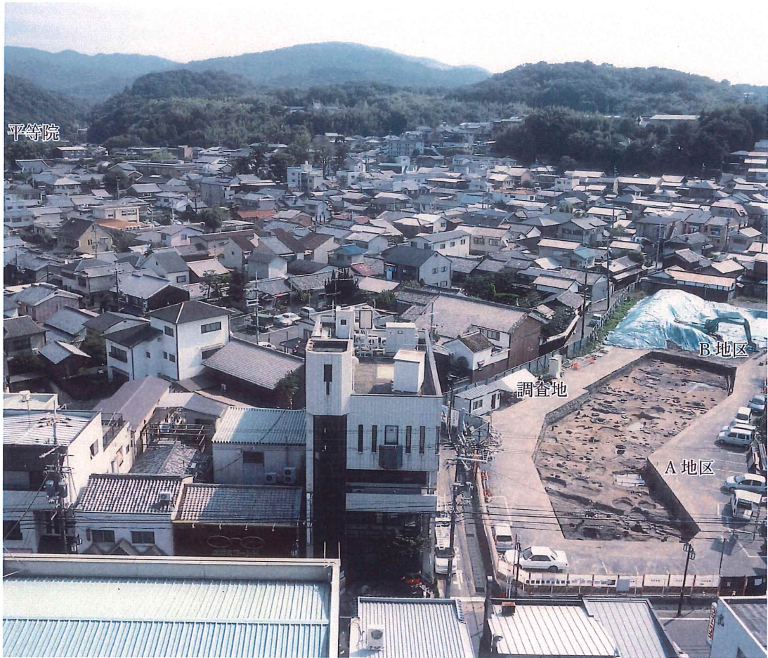
調査地と平等院…南南西から