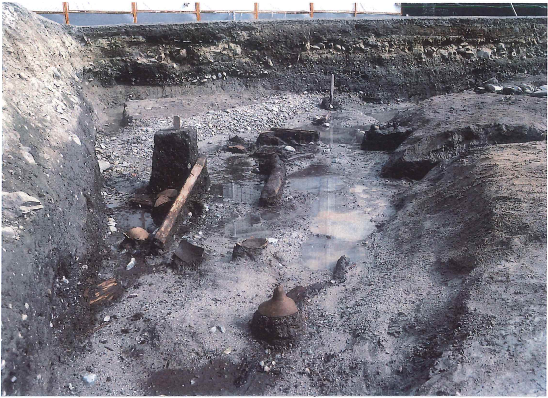
古墳中期流露跡 (SD302) …南南西から