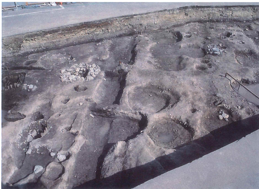
平安後期道路側溝 (SD262・292) 他…西から