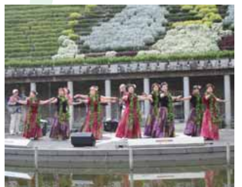
▲昨年度のたそがれサマーコンサートの様子

—お楽しみ抽選会— 寄せ植えや花苗などが当たります。各日、午前9時から、先着1000人の入園者(小学生以上)に抽選券を配布し、午後5時から抽選会を開催します。