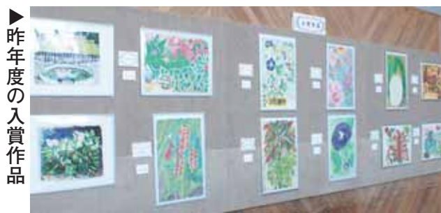
▶昨年度の入賞作品

◆規定：次のとおり ◎学校、公園、庭、山などの花や木、鉢植え植物などの身の周りにある植物、また、緑のある風景などの絵(人や建物が植物とともに描かれているものや実際の植物をテーマにした空想の絵も可) ◎大きさは四つ切り(542mm×382mm)画用紙 ◎材料・技法は自由(ただし工作ではなく、絵画であること)◎出展数は1人1点◎未発表の作品 ◆応募方法：作品裏面に必要事項を書いた応募票を張り、11月1日(土)～30日(日)(消印有効)に、郵送か直接、植物公園(〒611-0031 広野町八軒屋谷25-1)へ。 ◆入賞作品に関する権利は同園に帰属し、今後の広報事業などに使用することがあります。 ◆作品の返却を希望する場合は、27年3月6日(金)～8日(日)に、直接、同園へ。 ◆作品展示：27年1月21日(水)～3月1日(日) 植物公園(☎39-9387)にて開催予定