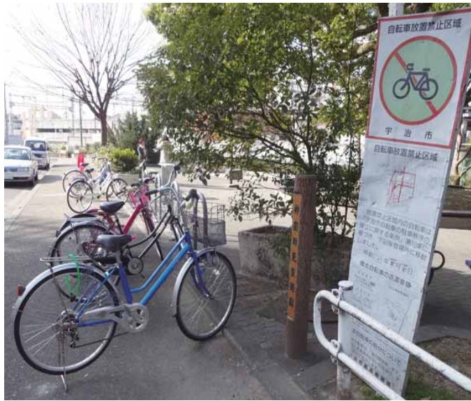
▲放置自転車は、交通の妨げとなり、交通事故の原因にもつながるため、絶対にやめましょう。

市では、放置自転車をなくすために放置禁止区域を指定し、警告の上、定期的に放置自転車の撤去を行っています。昨年は、市内全域で962台の自転車を撤去しました。中でも近鉄小倉駅周辺(120台)、近鉄大久保駅周辺(193台)、JR六地蔵駅周辺(114台)の3駅周辺で全体の約半