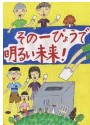
▲昨年度のポスター優秀作品(児童・生徒の部)

◆内容：明るい選挙を推進することを表すポスター1で、使用する啓発標語は「明るい選挙」に限らず、自由に考えてください。 ◆応募資格：次のとおり ◎児童・生徒の部：市内の小・中学校、高等学校の児童、生徒 ◎一般の部：市内在住の人(家族、友人、グループ)