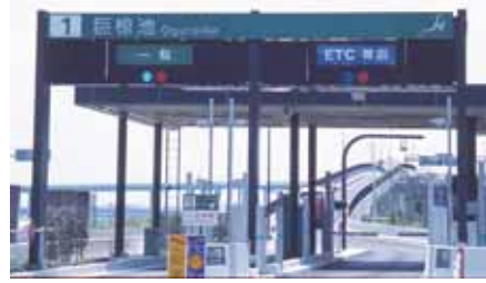
▲第二京阪道路巨椋池インターチェンジ

倉と巨椋に、使い分けがあったことは確かです。小倉は、池の東岸の村や集落の部分に限られます。一方の巨椋は、池そのものを指す場合に用いられてきました。つまりこれまで、前者は陸上、後者は水域と区別されてきたのです。なお、水域であったためでしょうか、第二京阪道路のインターチェンジの名称には「巨椋池」が採用されています。