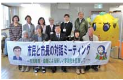
▲熱い思いを聞いてみませんか

市長が対話ミーティングを行います。当日、ミーティングを傍聴しませんか。 ◆とき…1月17日(土)、午後2時～3時40分 ◆ところ…うじ安心館 ◆申し込み…当日、午後1時55分までに、開催場所受付へ。