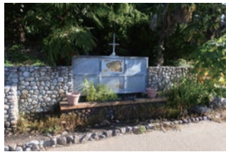
「巨椋池水のみち」モニュメント