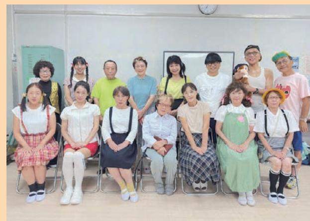
うじ昭和劇団の皆さん

演劇は初めてという団員も多く、大勢の観客の前で舞台に立つこと、声を出すことなど、新しいことに挑戦出来る楽しさを感じています。そして、本劇団が何より大切にしているのは、仲間の存在です。稽古場には笑顔があふれ、お互いに支え合い、刺激し合いながら3月1日の旗上げ公演に向けて稽古に取り組んでいます。