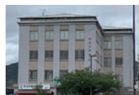
▲男女共同参画支援センター

男女共同参画支援センター (〒611・0021 宇治里尻5・ 9ゆめりあうじ3階) ☎ 39・9377 へ月曜・ 祝日を除く午前8時半～午 後5時。ただし、金曜日は 午後8時まで。☎ FAX 39・9378 ✉ danjokyoudou@city.uji.kyoto.jp