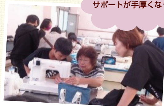
家庭科ボランティア