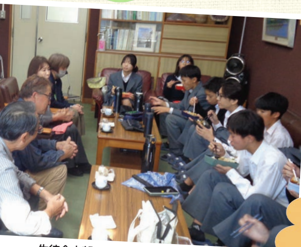
生徒会本部とCSランチョンミーティング