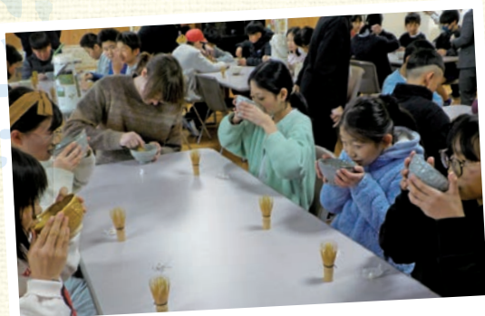
おいしい宇治茶大好きプロジェクト

全ての宇治市立小中学校で「コミュニティ・スクール」が開始されて4年目をむかえ、 新たな活動が始まったり、従来からの活動が広がったりしています。