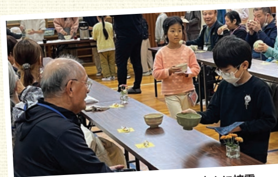
感謝祭で児童がお点前を地域の方々に披露