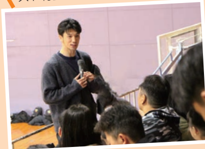
オリンピックボクシング金メダリスト村田諒太さんのトークショー