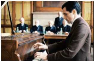
©2023 CINÉ@CINÉFRANCE STUDIOS-F COMME FILM-SND-FRANCE 2 CINÉMA-ARTÉMIS PRODUCTIONS

時 2月21日(土) ◎午 前10時半〜(開場は 午前10時) ◎午後 2時〜(開場は午後 1時半) 所 同セ ンター大ホール 800円 ◎当 日券 1千円(全席自 由)