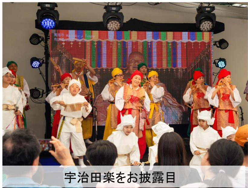
宇治田楽をお披露目