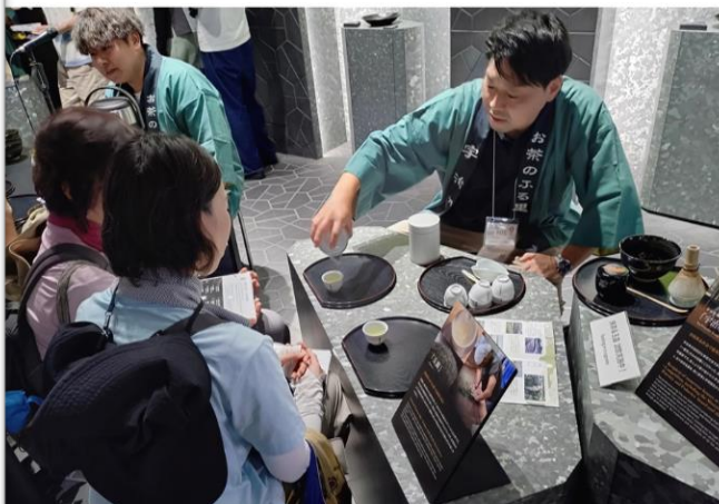
宇治茶の呈茶・振る舞い