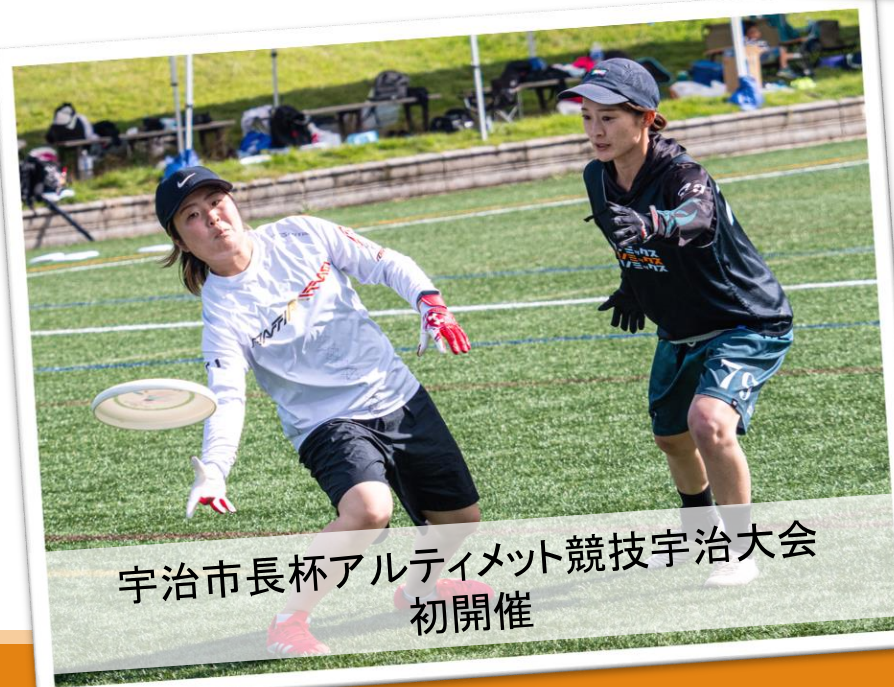
宇治市長杯アルティメット競技宇治大会 初開催