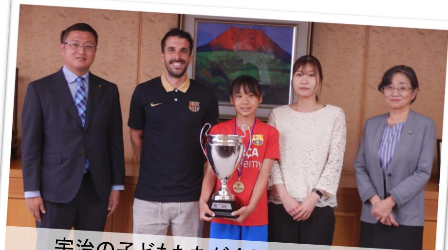
宇治の子どもたちが全国、世界で躍動