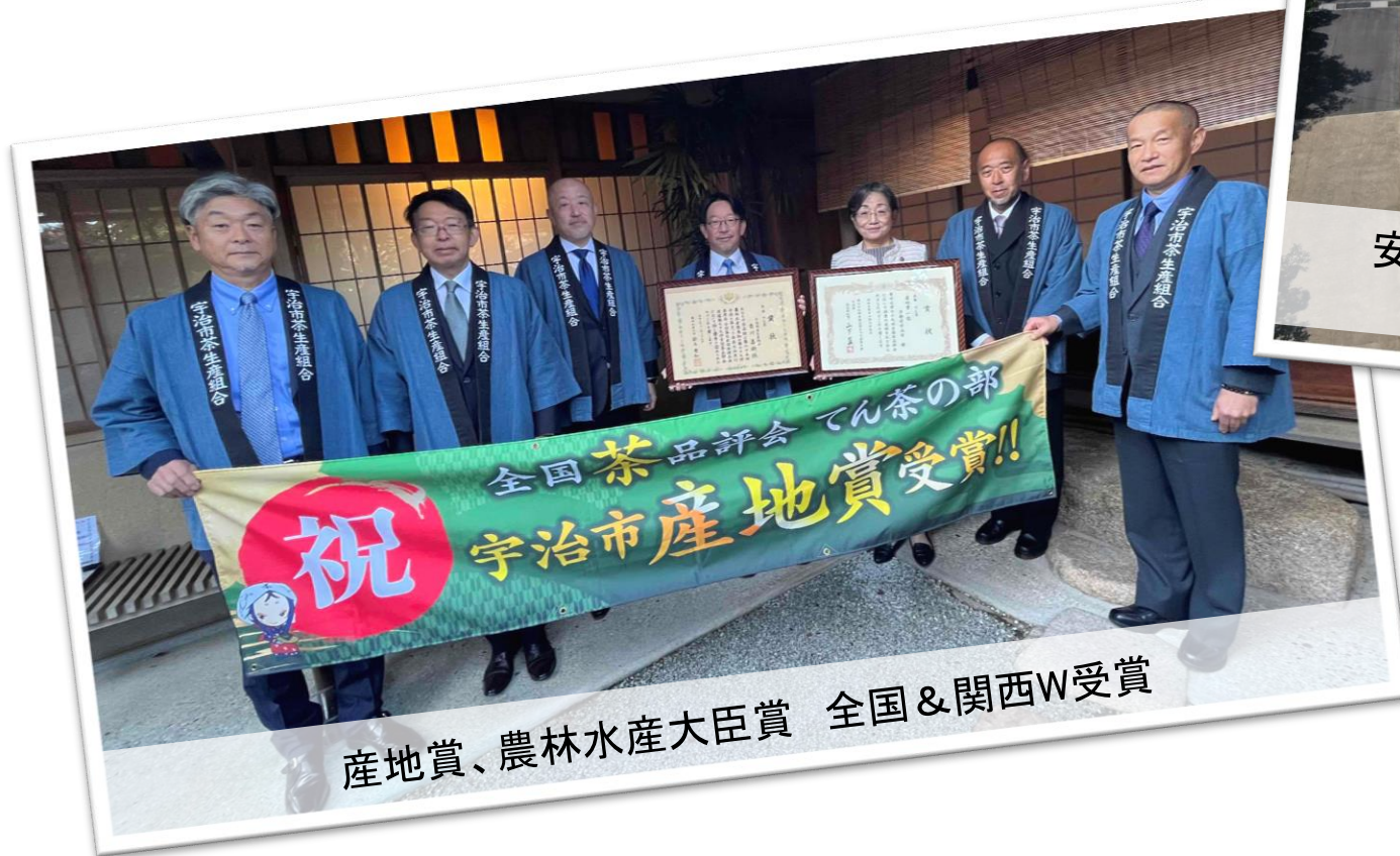
産地賞、農林水産大臣賞 全国&関西W受賞