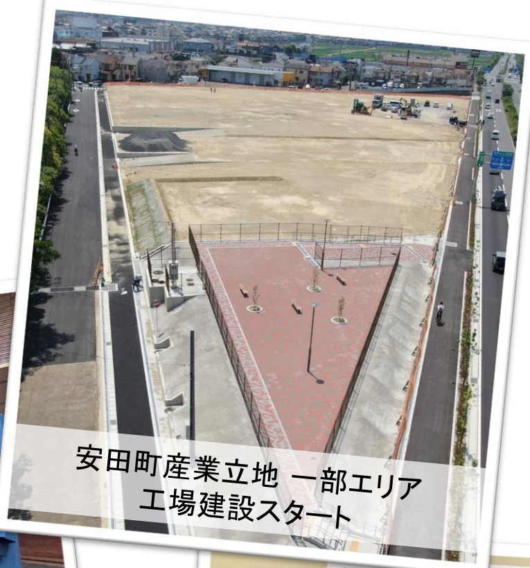
安田町産業立地 一部エリア 工場建設スタート