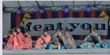
▲京都女子大学雅楽部