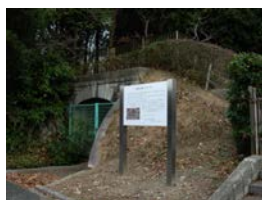
▲黄檗公園野球場西側には火薬庫の遺構が残され市平和都市推進協議会による説明版が設置されています。

全滅ではなかったものの、被害は周囲約4キロメートル四方に及び、142戸が全壊するなど約千戸が被災しました。火薬製造所の南側に隣接する五ヶ庄南部地区の人びとは、宇治橋を目指し南へ避難したそうです。