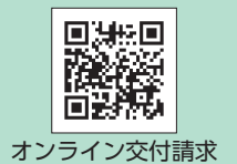
オンライン交付請求

《手続方法》市ホームページから手続きしてください。後日、証明書は住民登録地へ郵送します。