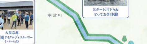
大阪京都市川周遊サイクルディスカバリー