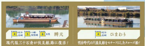
現代版三十舟が伏見航路に復活! 明治時代の川蒸気船をモチーフにしたクルーズ船!