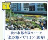
秋の水都大阪ウィーク 水の都パビリオン(仮称)