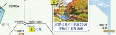
京都伏見の日本酒き酒体験と十舟乗船