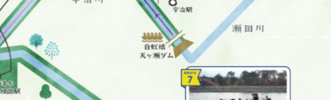
Eポート川下り&どっておき体験