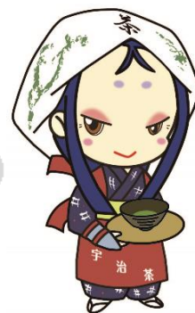
宇治市宣伝大使 ちはや姫

会長さんの連絡先や町内会・自治会の有無がわからない場合は、宇治市役所 2 階の文化自治振興課でお調べしますので、お気軽にお立ち寄りください。