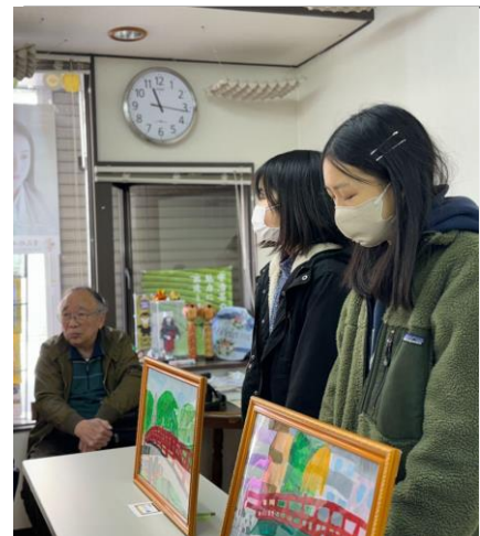
自分達の絵のグ ッズを売る