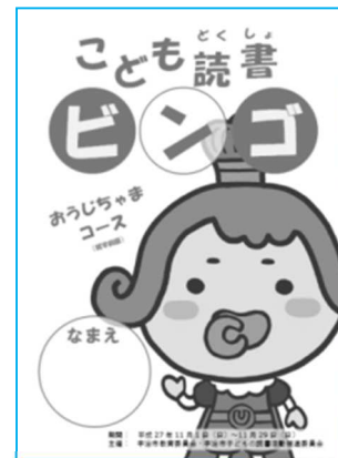
しょうがくまえばん 就学前版

ちゅうおうとしょかん にい えほん よ き 中央図書館のお兄さんが、絵本の読み聞 かせをするよ。ビンゴをやっていなくても さんが すべて 参加できます。全てのマス を埋めたビンゴの台紙を持 ってきてくれた人には、 せんちやく 50 にん しょうじょう 先着で50人に賞状とク リアファイルを渡します