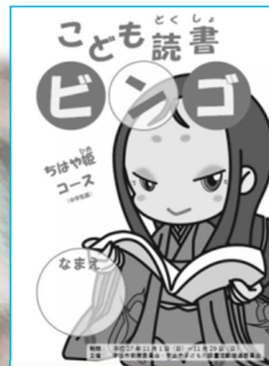
しょうがくせいばん 小学生版