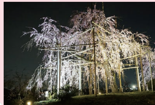
▲植物公園の夜間公開時のしだれ桜

●しだれ桜夜間無料公開 開花状況は公式Xなどで随時お知らせします。 時 3月20日(祝)～31日(日) 日曜日・祝日 午後5時～8時◎金・土・月曜日 午後5時～9時 ※開園日は午後5時に一度閉園します。 ※月曜日は休園日のため、午前9時～午後5時半は入園出来ません。