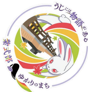
オブジェクトの回転