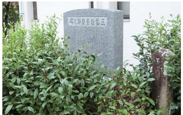
玉露製茶発祥が宇治市であることを示す石碑 (小倉公民館玄関脇)

天候などによって生育や製茶に大きく影響を受けることや、茶の木は樹木なので、過去数年にさかのぼった環境の影響も受けて結果として反映されることです。