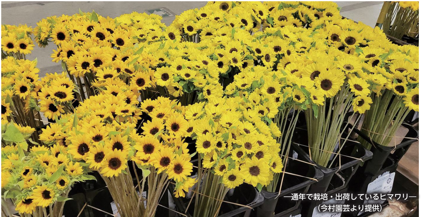
— 1年間で栽培・出荷しているヒマワリ —