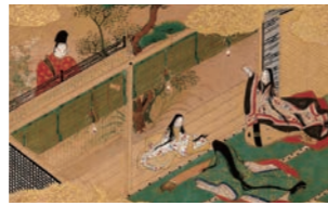
◀源氏絵鑑帖 (巻45 橋姫、宇治市源氏物語ミュージアム蔵)

☎ 6年2月4日(日)まで。午前9時～午後5時(入館は午後4時半まで) ※休館日(月曜日(祝日の場合はその翌日)、年末年始)を除く。会期中に展示替えあり。 ☎◎大人=600円 ◎小人=300円