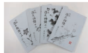
▲全文を訳し、まとめられた本