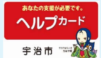
宇治市ヘルプカード