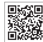
ゆかりの地 三市連携サイト