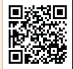
時短簡単 朝ごはんレシピ集