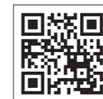
X (旧 Twitter)