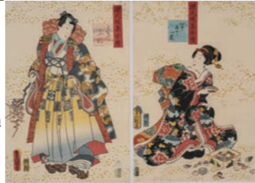
源氏後集余情 第五十一巻 うきぶね (宇治市源氏物語ミュージアム蔵) ▶