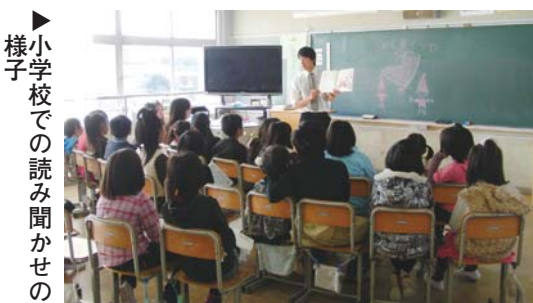
▶小学校での読み聞かせの様子