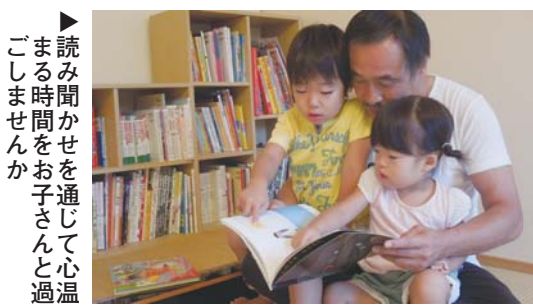
▶読み聞かせを通じて心温まる時間をお子さんとお過ごしませんか

子どもの生活の基礎となる家庭での読書環境は非常に大切です。幼い頃からの読書活動・経験は、子どもが自ら本を選び読みまわすきっかけとなり、その後生涯にわたって読書の楽しみを知ることにもつながります。少しの時間でも毎日、本を読み聞かせる、親子で一緒に図書館へ行く、読み聞かせ会に参加するなど、本に親