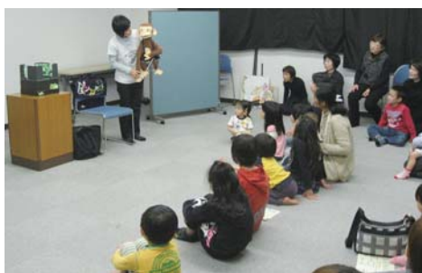
▶市子ども読書の日イベントに参加しませんか

図書館を中心とする公民館施設では、市子ども読書の日に関連したイベントを次のとおり行います。また、市では、子ども読書活動への理解の啓発・広報のために、市子ども読書活動推進ホームページを開設しています。