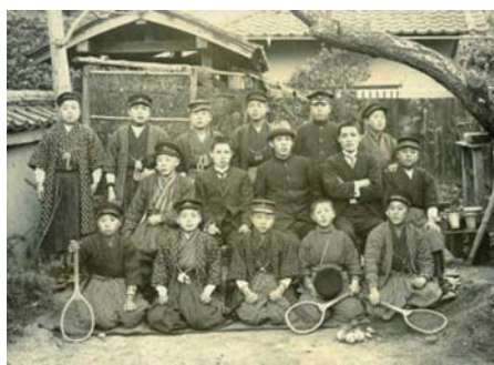
▲大正の頃、着物姿でテニスのラケットを持つ宇治小学校の子どもたち

歴史資料館では、こうした子どもたちの身近な歴史について、明治から昭和50年代まで、思い出と写真とモノで綴る特別展「子どもたちの近代誌」を11月18日(日)まで、開催しています。