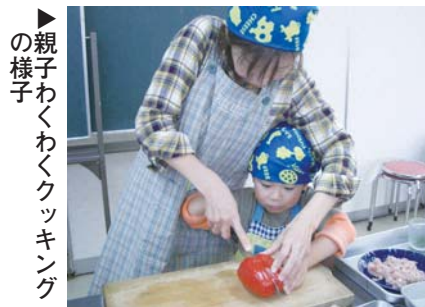
親子わくわくクッキングの様子

食育フェスタうじでは、子どもたちの「生きる力」の基礎となる「食育」について学び、楽しみながら