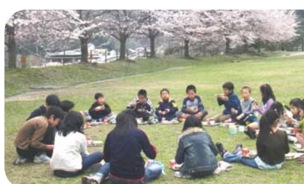
▲豊かな自然に恵まれた環境で学びませんか

◆申し込み：電話で、同校(☎075・571・0018)へ。なお、学校の様子は、同校ホームページ