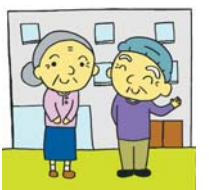
圏健康生きがい課