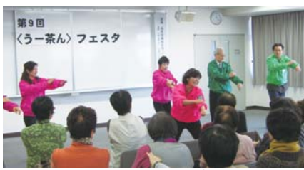
▲<うー茶ん>フェスタに参加してみませんか