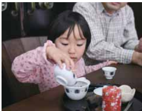
▲お茶のいれ方を学びませんか