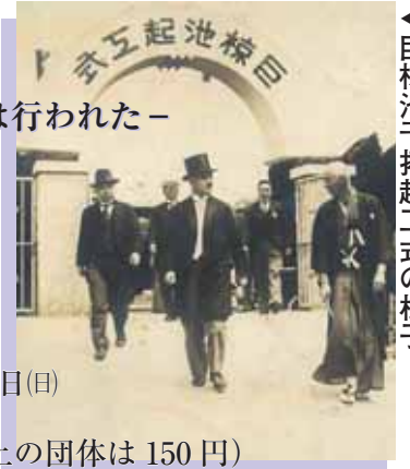
巨椋池干拓起工式の様子

昭和8年に着工し、16年に完成した巨椋池干拓工事。本年は、完成後70年目を迎えます。本展では、当時の貴重な史料や写真を用いてその経緯などを紹介します。