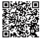
携帯電話版ホームページQRコード