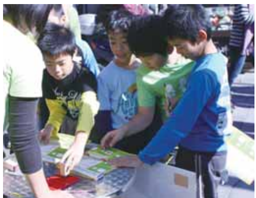
▲スタンプラリーの参加者には、参加賞(先着1200個)もあります