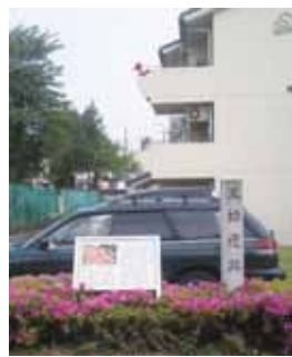
▲巨椋遺跡の案内板

辺からは、小規模な古墳や住居の跡が確認され、古くから人びとが住み続けていたことがわかります。そんな巨椋遺跡の案内板は市営住宅の敷地内に設けられ、隣に幼稚園、その前には公会堂と巨椋神社が接しています。 ともに身近に歴史の重層性を感じるところです。