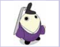
▲国民文化祭・京都2011 PR隊長「源氏物語ミュージアム版まゆまる」

審議会などの傍聴やパブリックコメントの募集のほか、市民の皆さんと一緒にさまざまな事業に取り組んでいる生涯学習センターや公民館、男女共同参画支援センターからのお知らせを掲載します。■は「問い合わせ」、●は「申し込み」、■が書いていないものは直接会場へお越しください。