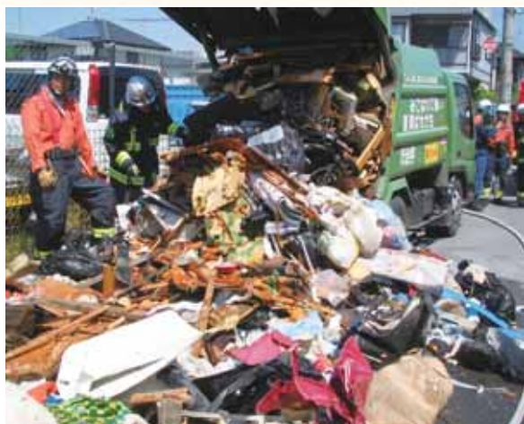
▲パッカー車で火災事故が起こると、路上での消火作業となり、大変危険です。