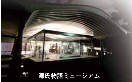
源氏物語ミュージアム