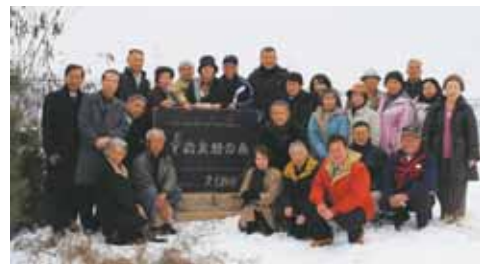
▲前回(21年度)の訪問団の様子