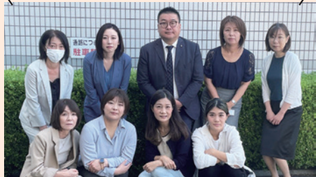
市健康づくり・食育アライアンス U-CHA 加入団体 富国生命保険相互会社 宇治営業所

私たちは、生活習慣病の予防や、乳がん・子宮頸がんの早期発見等の大切さを伝える「ピンクリボン運動」にも力を入れています。