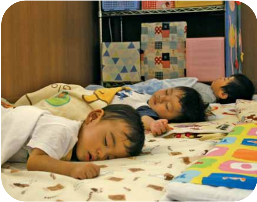
▲みんなですやすやお昼寝タイム。どんな夢を見ているのかな？(市内の保育園で撮影)

発行 宇治市 編集 広報課 〒611-8501 宇治市宇治琵琶33 ☎ 22-3141 (代表) FAX 20-8779 ホームページ http://www.city.uji.kyoto.jp/ 携帯 http://m.city.uji.kyoto.jp テレホンサービス ☎ 20-8777