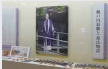
▲源氏物語ミュージアム特別展「瀬戸内寂聴と20人展」の様子

源氏物語ミュージアム(☎39-9300)・歴史資料館(☎39-9260)では、11月20日(土)・21日(日)の2日間、観覧料が無料となります。ぜひ、お越しください。