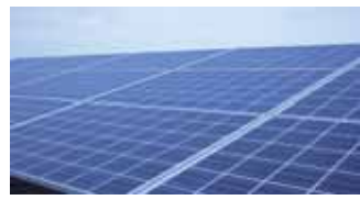
太陽光発電の様子 環境企画課

◆申し込み…所定の申請書に必要書類を添えて、直接、環境企画課へ。申請書等は、同課で配布しているほか、ホームページ( http://www.city.uji.kyoto.jp/ )からも印刷できます。